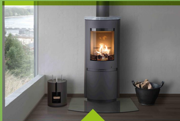
Model: Scanline 8 Producent: Heta A/S emisja pyłów PM przy 13% O 2 : <3 mg/m 3 (Ekoprojekt wymaga <40 mg/m 3 )