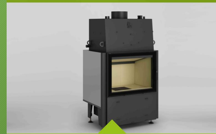
Model: Volcano W-18 Producent: Hajduk Agnieszka i Dariusz Nasińscy sp. z o.o., sp.k. emisja pyłów PM przy 13% O 2 : 5 mg/m 3 (Ekoprojekt wymaga <40 mg/m 3 )